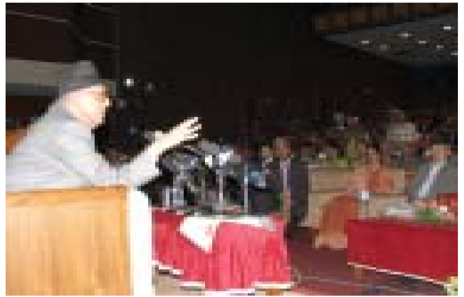
सम्मेलन उद्घाटन समारोहलाई सम्बोधन गर्दै प्रधानमन्त्री कोइराला।

आर्थिक मन्दी आएको समयमा पनि रैमिटेन्सको माध्यमबाट नेपाललाई असफल राष्ट्र