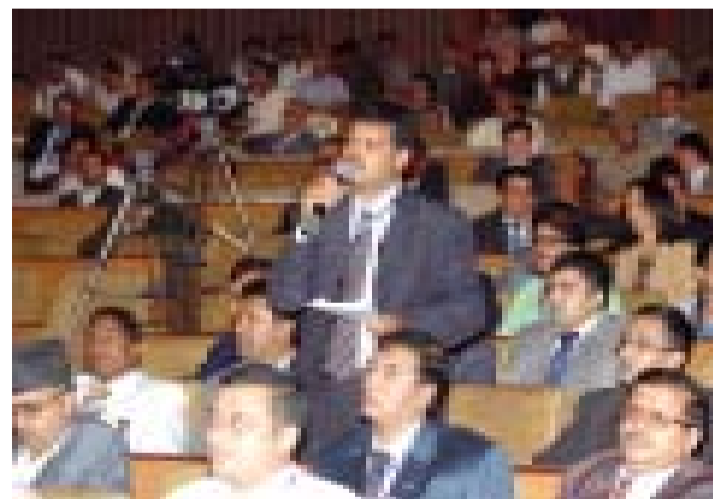
सोमबासम्पन्नराजनीतिक दलका नेताहरुसंगको अन्तर्क्रियामा एनआरएनहरु।

वैदेशिक रोजगार प्रवर्द्धनका लागि स्वतन्त्र बोर्ड गठन, न्यायाधिकरण, श्रम सहचरी र महिलालाई वैदेशिक रोजगारीमा पठाउने व्यवस्था लगायत एजेन्टलाई समेत व्यवस्थित गर्ने गरी काम शुरु गरिसकेको समेत बताउनुभयो।